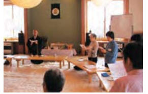
みんなて学びを深めます