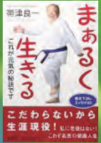
帯津良一著 海電社