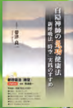
帯津良一著 佼成出版社