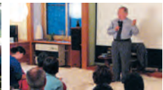
帯津先生に何でも質問OK