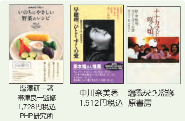
塩澤研一著 帯津良一監修 1,728円税込 PH-R研究所 中川奈美著 塩沢みどり監修 1,512円税込 原書房

いのちの森の大自然のエネルギーは、心と体を癒し、自然治癒力を高めます。隣接する水輪ナチュラルファーム自然農園では農薬や化学肥料を一切使用せずお野菜を作り、環境と健康に配慮した農法を行っています。大切に保護された自然は、やどりぎや銀竜草など高山植物、また山野草の宝庫です。館内寝具類は清潔を保ち、施設には和紙の照明、建物は天然木の檜や杉材を使用することで、人工的な建材によって遮断されることなく大自然のもつ澄んだ空気を、存分に味わうことができます。厳選された無添加の食材・調味料、無農薬野菜などを使った心ごもった美味しい食事は心身をリフレッシュしてくれます。