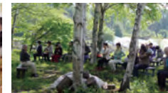
帯津先生と気功三昧