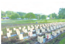
作物の養生 あんどん