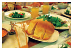
完全手作りのお料理