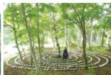
タマヌール 石の螺旋