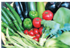
無農薬自然農のお野菜