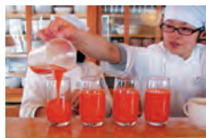
無農薬人参ジュース

自分に素直に生きることによって、わざわざ社会に貢献しようとは思わなくても、自然と社会に貢献していける。この発言は、驚いた。何か社会の為になることを正しいこと、目的とすることがより良い自分を作り上げるものだと思っていた。素直な自分とは何か。客観的に自分を観察する習慣化が、自分の本来求めているものを知る手掛かりとなるようだ。気持ちを抑え込んで無理に考えて変えようとするのではなく、眺める。自分を冷静に観られる様、日々の中で、自分を観察する。感情ではなく事実を観て、事実と感情は別だということを知ることによって、気持ち、感情に振り回されない生き方をすることが出来る。感情的になる前に、一度観察することを習慣化していきたいと思う。