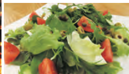
無農薬、無化学肥料のお野菜料理