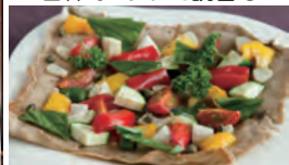
自然農園お野菜メニュー