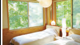
大自然の中でゆったり