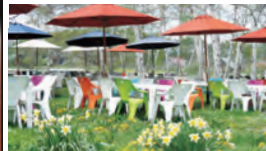
白樺ガーデンで読書も