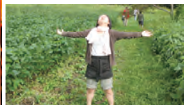
朝露ウォークセラピー