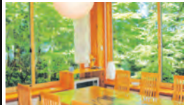
緑に囲まれたレストラン