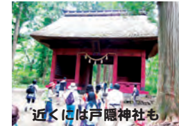
近くには戸隠神社も