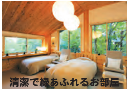
清潔で緩あふれるお部屋