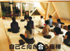
自己と向き合う座禅

魔訶般若波羅密多心経 観自在菩薩 行深般若波羅密多時 照見五蘊皆空 度一切苦厄 舍利子 色不異空 空不異色 色即是空 空即是色 受想行識亦復如是 舍利子 是諸法空想 不生不滅 不垢不淨 不增不減 是故空中無色 無受想行識 無限耳鼻舌身意 無色声香味触法 無境界乃至無意識界 無無明 亦無無明尽 乃至無老死 亦無老死尽 無苦集滅道 無知亦無得 以無所得故 菩提薩垂 依般若波羅密多故 心無罣礙 無罣礙故 無有恐怖 遠離一切顛倒夢想 究竟涅槃 三世諸仏 依般若波羅密多故 得阿耨多羅三藐三菩提 故知般若波羅密多 是大神呪 是大明呪 是無上呪 是無等等呪 能除一切苦 真實不虛 故説般若波羅密多呪 即説呪曰 羯帝羯帝 波羅羯帝 波羅僧羯帝 菩提 僧莎訶 般若心経