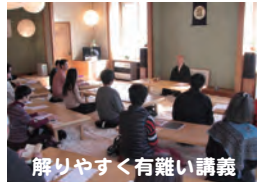
解りやすく有難い講義