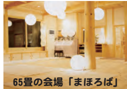
65畳の会場「まほろば」