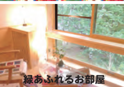
緑あふれるお部屋

が通らない、通してもらえない事に対して、相手に怒ってしまっている。これ自分のやり方が通らない、通してもらえないという事はずね、相手に怒るよりかは、そんな暇あったら、もっと上手にそれ通すように自分が工夫する。自分が工夫出来なくて、鈍臭いやり方しちゃった事に対して怒る位ならまだいいんですけどね。相手に対して怒っちゃったらですね、自分は変わらないけどあんた変わってよ、という怒りな訳ですね。そういう様な事に基ついて言葉を発してしまいますと、これは自分の潜在意識を汚してしまいますし、同時に相手、言われた方とは関係が悪くなってしまいます。自分の潜在意識からも環境からも、将来に対する良くない種を植え込んだ事になってしまう訳ですね。ですから、「悪口」と書いて「あつく」、悪口を言わない《不悪口》、「ふあつく」というんですね。(つづく) 宮島 基行