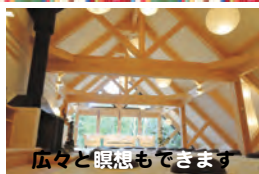
広々と憩もできます