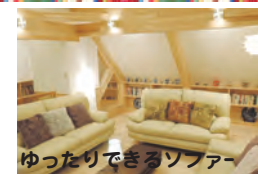
ゆったりできるソファ