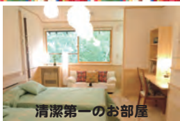
清潔第一のお部屋