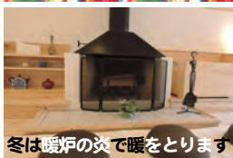
冬は暖炉の炎で暖をとります