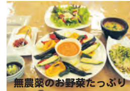
無農薬のお野菜たっぷり