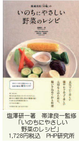
塩澤研一著 帯津良一監修 「いのちにやさしい野菜のレシピ」 1,728円税込 PHP研究所