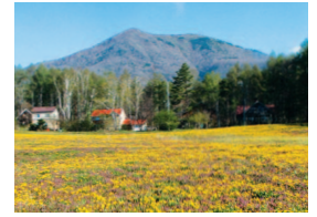
一面のたんぽぽ畑