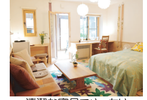
清潔な寝具でゆったり