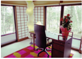
しゅり庵リビング