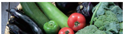
自然農園のお野菜たち