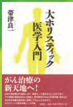
帯津良一著 春秋社